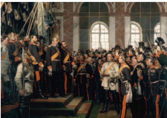
Reichsgründung, Spiegelsaal Versailles.

2. Wer war erster deutscher Reichskanzler?